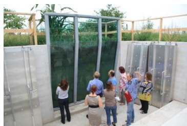
Kořenová aréna v Bioforschung Austria