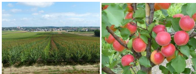
Ovocné školky Baum u. Rebschule Schreiber KG

Předběžná cena exkurze 700 Kč zahrnuje dopravu autobusem z Brna a Mikulova. Členům Biosadu bude poskytnut příspěvek ve výši 250 Kč na osobu (max. 2 osoby za podnik). Oběd, který bude zajištěn v restauraci, si hradí každý sám (odhad do 25 EUR). Doporučujeme sebou do autobusu pití a svačinu na celý den.